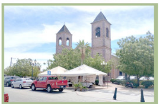
Instalan en catedral de La Paz módulo de canje de armas