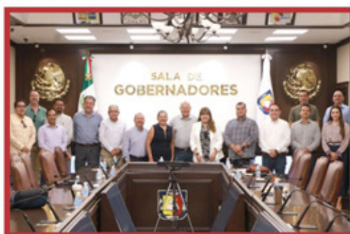
Gobierno y CCE fortalecen diálogo por Plan México