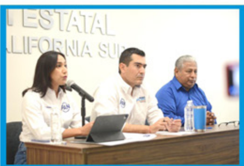
IEE admite denuncia del PAN por promoción anticipada en BCS