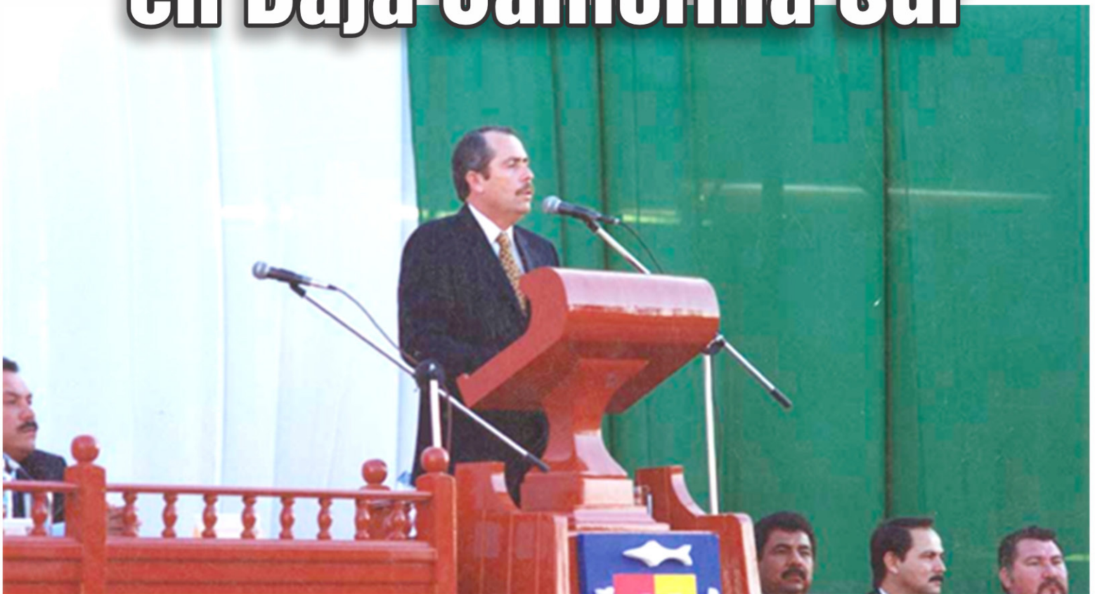
Toma de Protesta como Gobernador Leonel Cota Montaño.